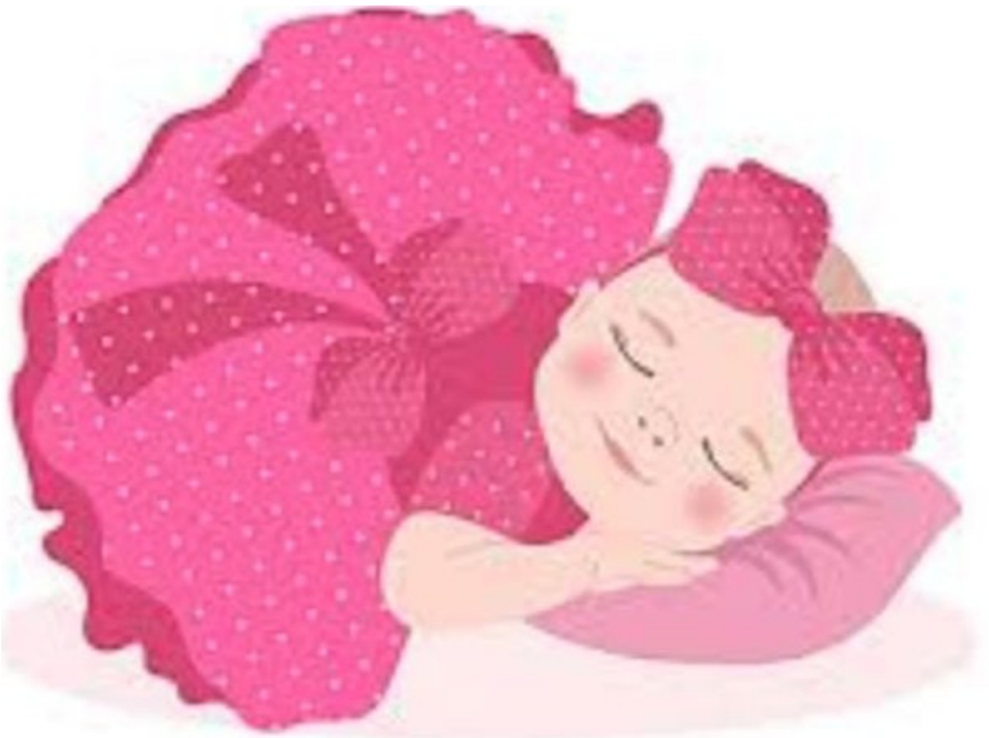
Ilustrasi gambar bayi

BUKITTINGGI — Warga digegerkan dengan penemuan seorang bayi perempuan di bawah Hotel Balcone, dekat Kantor Samsat Bukittinggi, Kamis (15/01/2026) pagi. Bayi tersebut ditemukan dalam kondisi masih sangat kecil dan mengalami hipotermia akibat kedinginan.