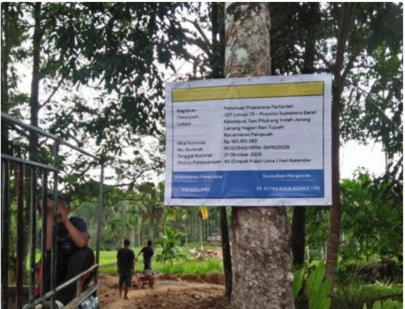
Proyek Pokir DPRD Sumbar di Jorong Sipisang Dan Lariang Terbengkalai, Warga Keluhkan Kontraktor

AGAM – Proyek Penataan Jalan Pertanian yang bersumber dari Program Pokok Pikiran (Pokir) Anggota DPRD Provinsi Sumatera Barat tahun 2025 di Jorong Sipisang dan Jorong Lariang, Nagari Nan Tujuh, Kabupaten Agam, Sumatera Barat dikeluhkan warga karena dinilai terbengkalai dan sekarang sudah tahun